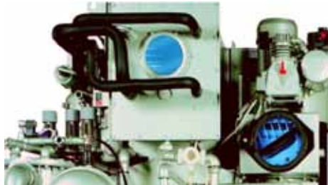
Pohled na chladicí jednotku

hotova během tří hodin. Výměna chladiva Vás navíc zbaví povinnosti vést Evidenční knihu chladicích zařazení a provádět prostřednictvím autorizované osoby každoroční zkoušky těsnosti chladicích okruhu.