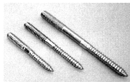
Materiál – ocel s povrchovou úpravou – galvanický zinek